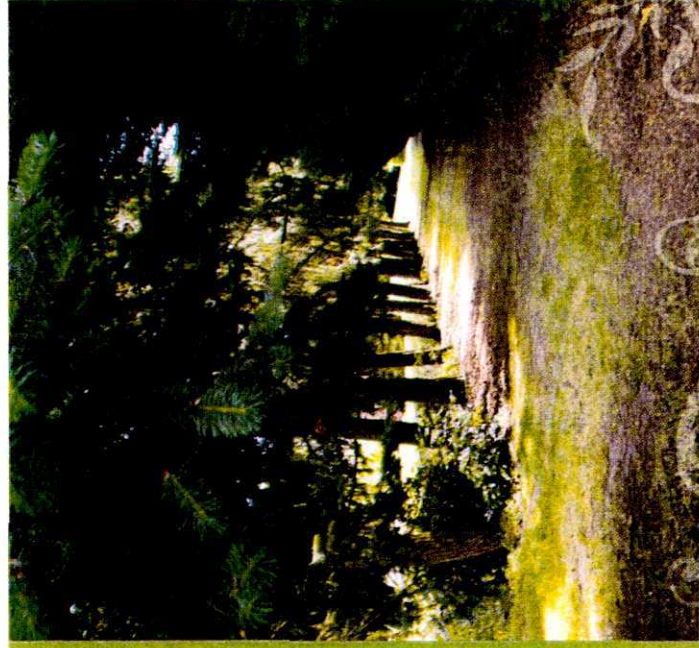
Senderos de la Soledad

Durante varios años La Soledad fue un lugar de peregrinación para los miembros y amigos de la Familia de Santa Cruz. Como la beatificación del Bienaventurado Basilio Moreau ha aumentado la devoción a él, las Marianitas de Santa Cruz ofrecen el lugar histórico como un centro de hospitalidad y de enriquecimiento espiritual para los miembros de Santa Cruz, sus compañeros de trabajo, colaboradores y amigos. La Soledad seguirá actuando como un centro para la educación y la investigación.