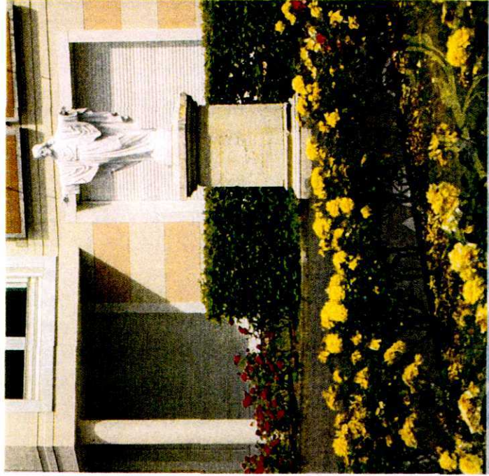
Verano a la Soledad