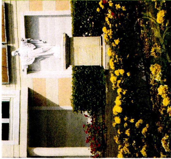
L'été à la Solitude

Le centre de pèlerinage Sainte-Croix a été établi par les Marianites de Sainte-Croix, à l'automne 2008 à La Solitude du Sauveur Mans, France.