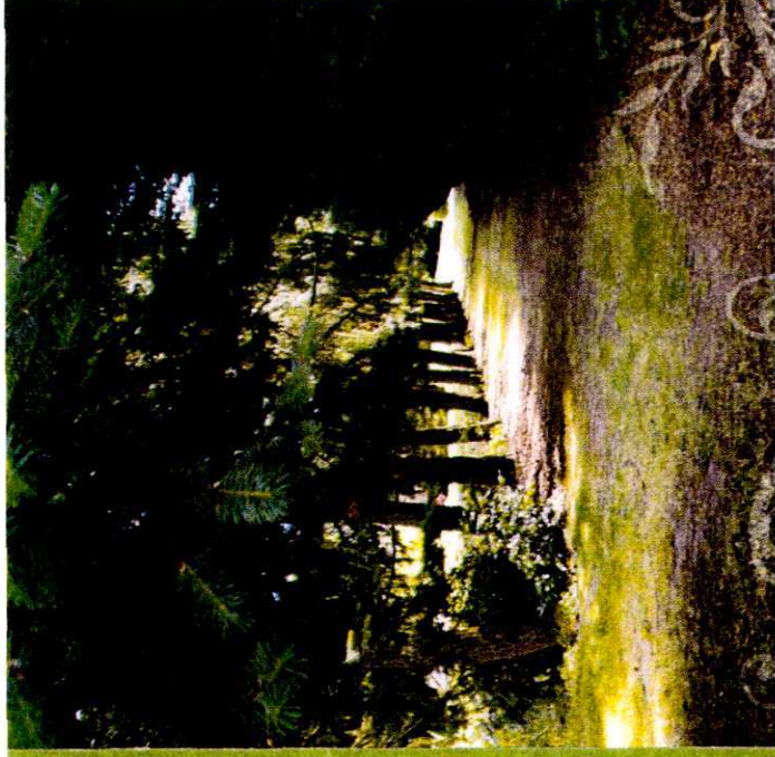
Les sentiers de la Solitude

Durant plusieurs années, cet endroit a été un lieu de pèlerinage pour les membres et les amis de la Famille de Sainte-Croix. Comme la béatification du Bienheureux Basile Moreau a accru la dévotion en lui, les Marianites de Sainte-Croix offrent cet endroit historiquement comme centre d'hospitalité et d'enrichissement spirituel pour les membres de Sainte-Croix, leurs collègues, associés et amis. Il va également continuer à se développer et à servir comme centre pour l'éducation et la recherche.